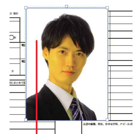
画像の中をつかんで位置を移動